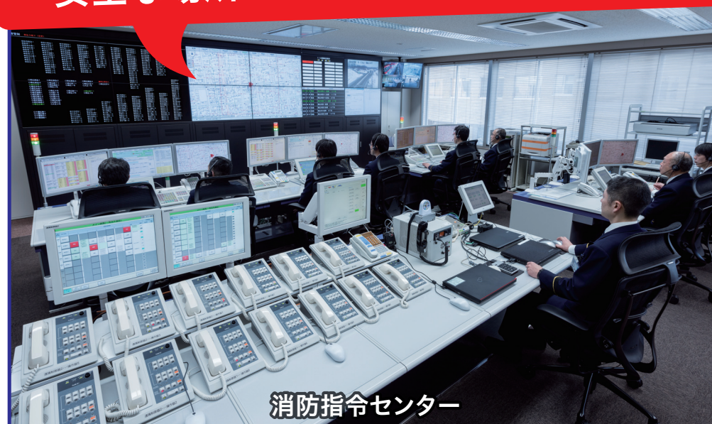
消防指令センター